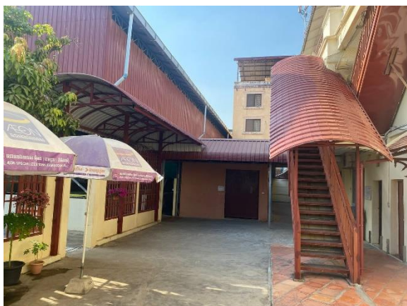
警備員室の改装 【施工業者 HVR Engineering Technology】