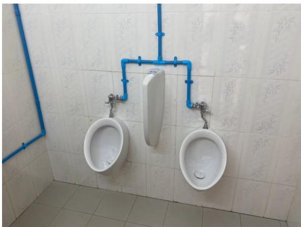
3階トイレ4か所、2階職員トイレ2か所換気扇設置 【施工業者 新日本空調カンボジア支店・佐藤工業カンボジア支店】