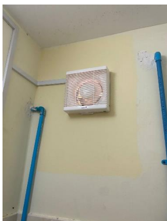
2階職員女子更衣室